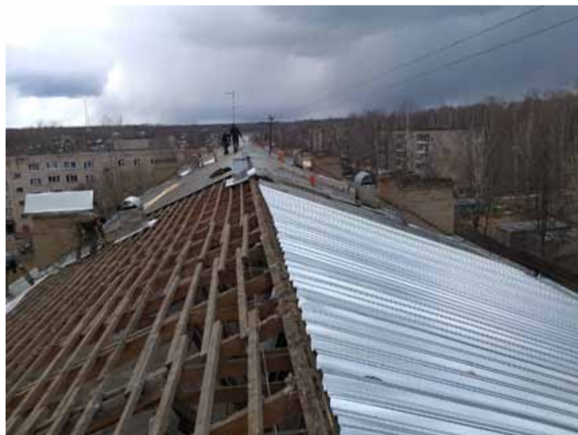
ул. Опарина, 21. Монтаж профнастила

Продолжают вносить взносы на капремонт дома ул. М. Гвардии, 12 и ул. Мопра, 6В. Решение о том, чтобы платить иной размер взноса, отличный от официального, собственники приняли давно. В 2019-м собственники ул. М.Гвардии, 12 попросили нас просчитать, какую сумму надо доплатить на спецсчёт, чтобы отремонтировать крышу в 2020 году. Расчёт был сделан на 6 месяцев, вышла сумма взноса 17,15 руб. с 1 кв. метра занимаемого помещения. Это почти вдвое выше установленного минимального размера взноса на капремонт. Голосование за такое решение состоялось в декабре 2019 года, и с 1 января дом пере-