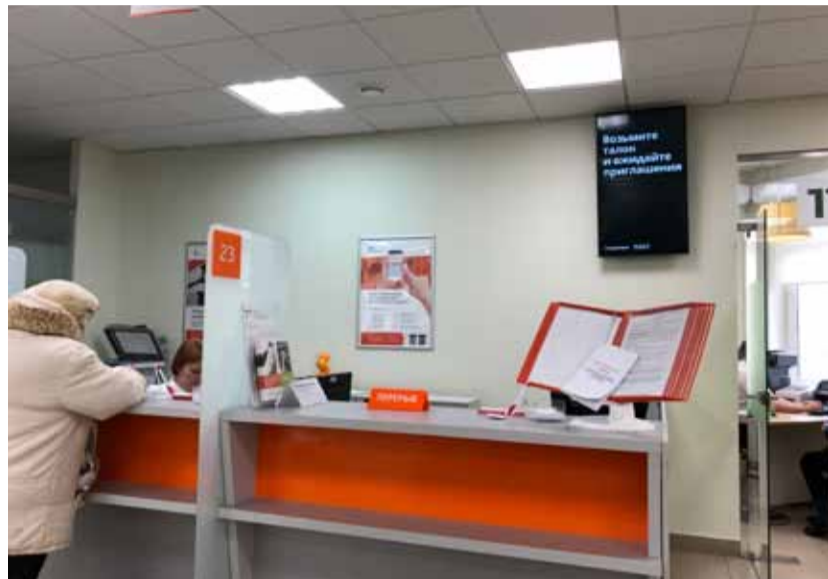
Онлайн онлайн, а оплата через кассу банка по-прежнему пользуется у людей спросом. К сожалению, нашему корреспонденту так и не удалось найти информацию для клиентов, предупреждающую о внимательной проверке реквизитов при оплате

теля денежных средств для УК «Дружная». Это ООО «РЦ «Вятка». ИНН этой организации указан в квитанции, которая находится перед вашими глазами. Уже при заполнении квитанции при опла-