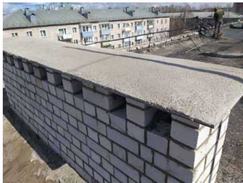
ул. Пушкина, 32А. Новая вентиляционная шахта

ные мероприятия - выходили на объекты, делали замеры ремонтируемого конструктива и расчёт стоимости работ, составляли сметы, передавали пакет документов для голосования собственников. Сейчас, когда установилась тёплая погода, начинаются ремонтные работы на улице, в основном по фасадам.