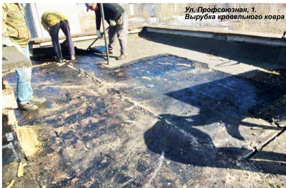
Ул. Профсоюзная, 1. Вырубка кровельного ковра

Сегодняшние объёмы капитальных работ – не предел. Мы в состоянии сделать больше, были бы заявки со стороны собственников. Но в предыдущие два года подрядчики ударно поработали в общей сложности на 38 МКД Нововятска, где собственники заказывали довольно-таки затратные ремонты, стараясь прежде всего привести в порядок кровли и фасады. Средства потра-