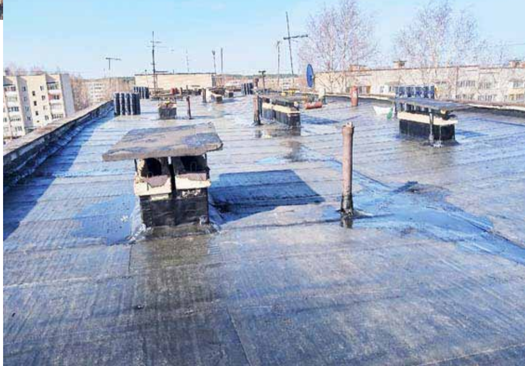
Ул. Профсоюзная, 1. Устройство нижнего слоя кровельного ковра

капремонт фундамента ул. Кирова, 71, ул. Опарина, 11, капремонт крыши ул. Мопра, 2, ул. Красноармейская, 1, ул. Мопра, 4В, капремонт фасада ул. Тр.Пушкарева, 4, ул. Советская, 87.